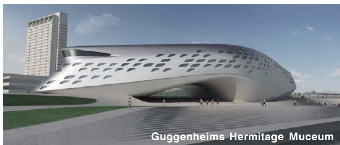
Guggenheims Hermitage Muceum