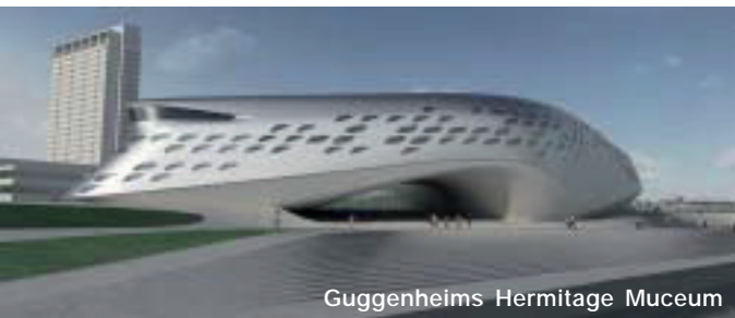
Guggenheims Hermitage Muceum