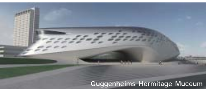
Guggenheims Hermitage Muceum